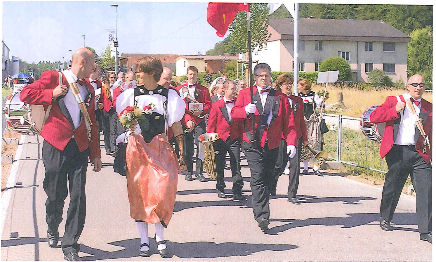
Wunderbares Festwetter, entspannte Gesichter: Die Brass Band Schüpfen nach ihrem Auftritt. Un temps magnifique et des visages détendus: le Brass Band de Schüpfen après sa prestation.