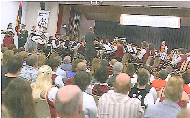
Teilnehmerrekord: Am Fest unter dem Motto «wunderBAare Musik» nahmen 139 Formationen teil.

Belle tradition: de nombreuses sociétés de musique étaient précédées par des dames d'honneur en costume bernois.