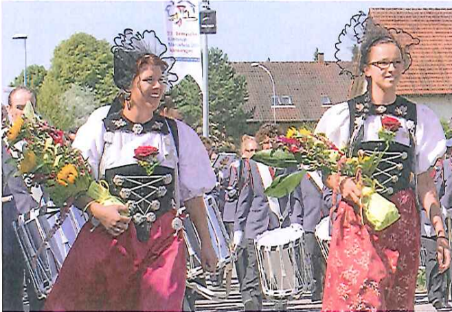
Schöne Tradition: Viele Musikgesellschaften wurden von Ehrendamen in Berner Trachten begleitet.

Belle tradition: de nombreuses sociétés de musique étaient précédées par des dames d'honneur en costume bernois.