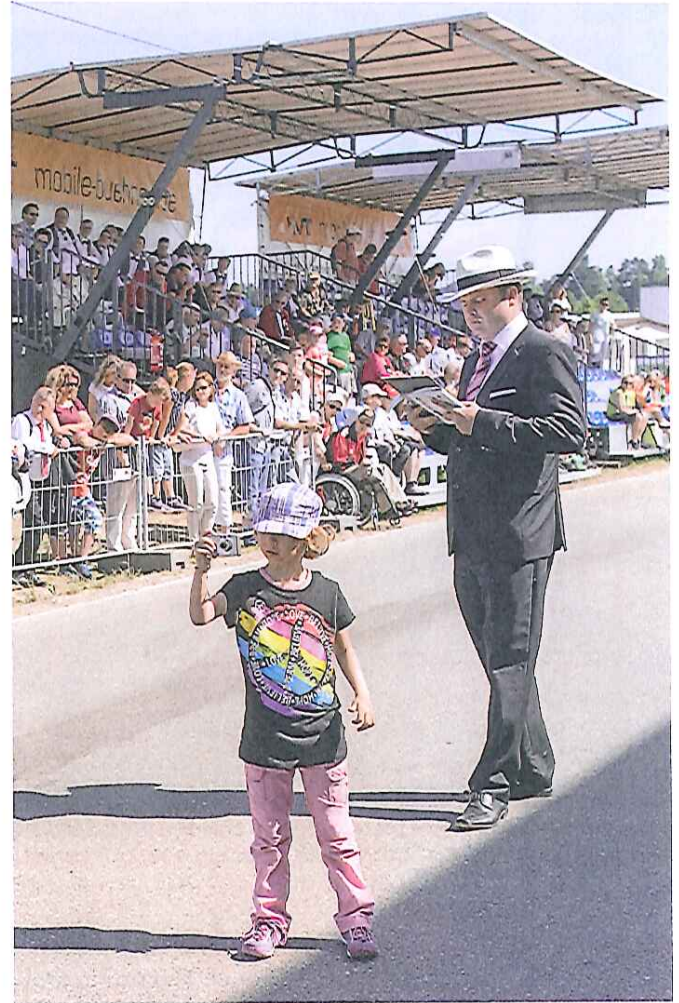
Kein Jurywagen, dafür eine Tribüne: Die Experten bewerteten die Marschmusik entlang der Strecke.

Record de participation sous le slogan difficilement traduisible: «wunderBAare Musik». 139 formations y ont pris part.