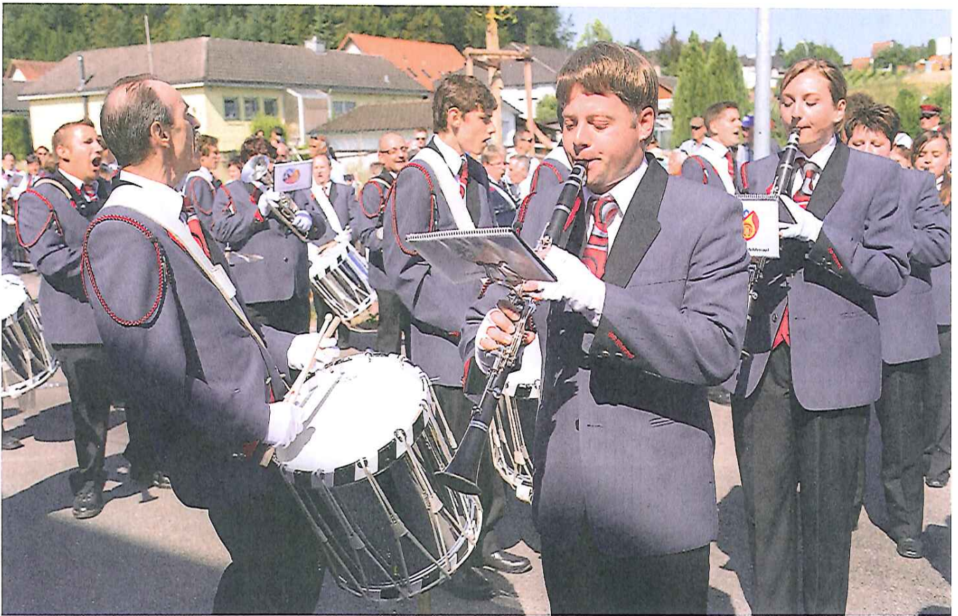
Freude beim Publikum, «gute Leistung» bei den Experten: Die MG Wilderswil präsentierte den «Gangnam Style». Joie dans le public, «bonne prestation», jugent les experts: la MG de Wilderswil a présenté «Gangnam Style».

Aufgabestück «Etosha» von Armin Kofler 95 Punkte, fürs Selbstwahlstück 96,33 was ein Total von 191,33 ergab – die höchste vergebene Punktzahl beim Konzertwettbewerb. Die MG Ostermundigen erspielte sich den zweiten Rang (91, 87,33, 178,33), ihr folgt die MG Aarberg (90, 85,33, 175,33). Gewinnerin der Parademusik ist die MG Rüschelen (104,5 Punkte), vor Ostermundigen und Walperswil (beide 103).